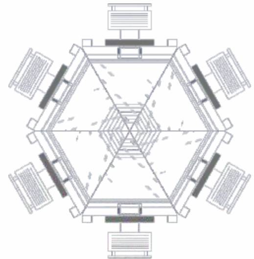
gestalterische Freiheit bei Gruppenbildung