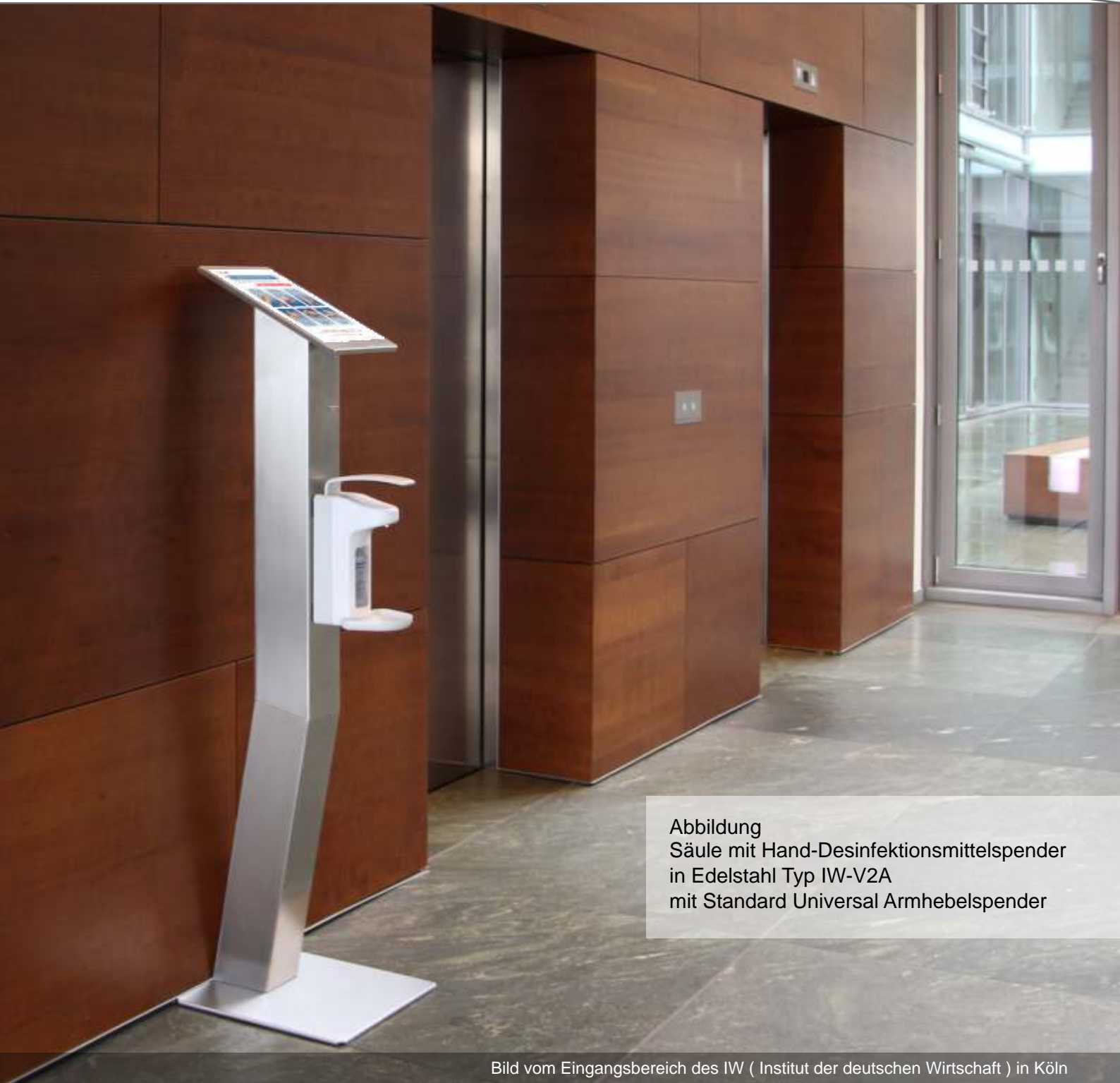
Abbildung Säule mit Hand-Desinfektionsmittelspender in Edelstahl Typ IW-V2A mit Standard Universal Armhebelspender