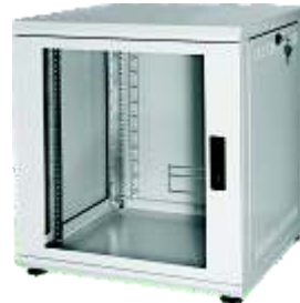
600er mit Nivellierfüßen