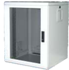
Ausführung - Lüftermontage vorbereitet