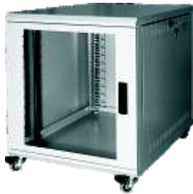
800er mit Doppellenkrollen