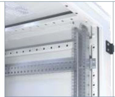
19" Ebene vorne